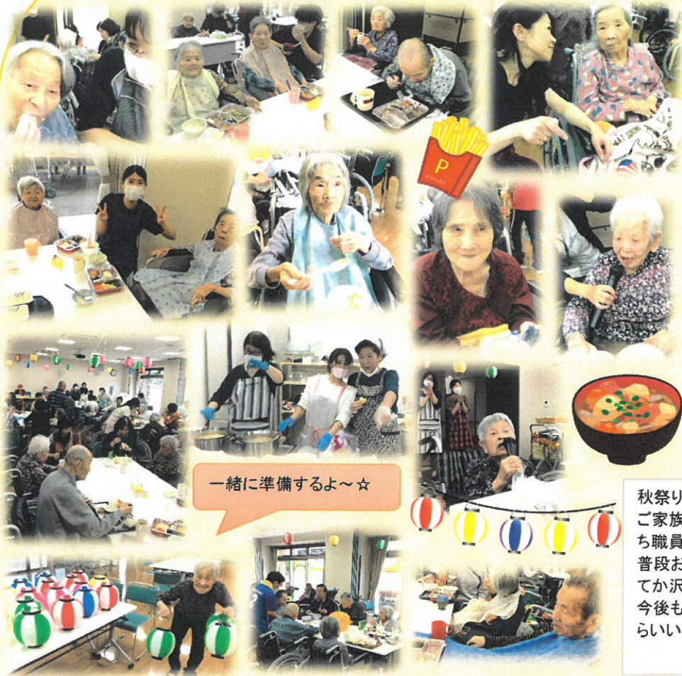
一緒に準備するよ～☆